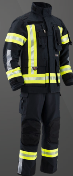
Nomex® NXT Dunkelblau / Dunkelblau 502