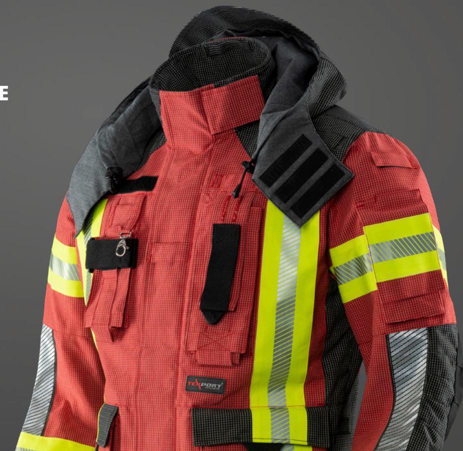
Abb. GUARDIAN RSQ Jacke, PA06, 539 mit Kapuze, PA06, 203