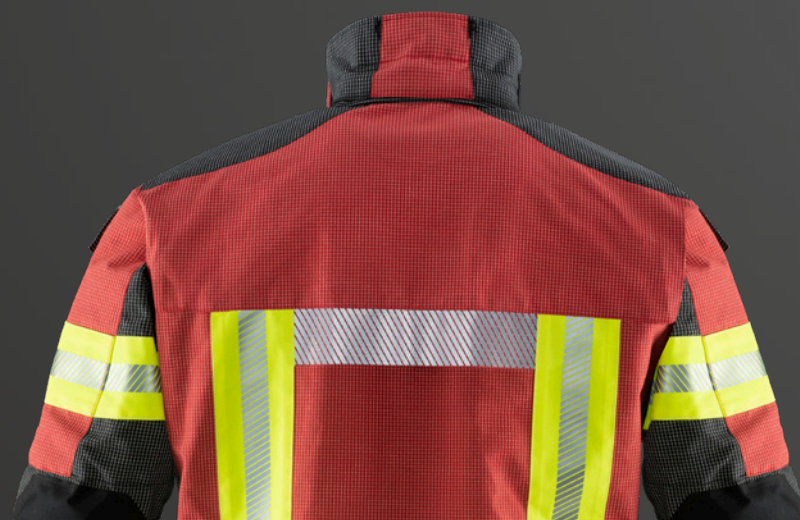
Abb. GUARDIAN RSQ, PA06, 539