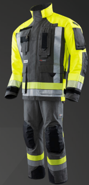
IB-TEX® Dunkelblau / HiVis Gelb 523