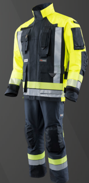
Nomex® NXT Dunkelblau / HiVis Gelb 523

Stand: Sommer 2026 | Satz- und Druckfehler sowie Änderungen vorbehalten. Aufgrund drucktechnischer Gegebenheiten können Farbabweichungen zwischen den Darstellungen im Katalog und den Original-Produkten auftreten.