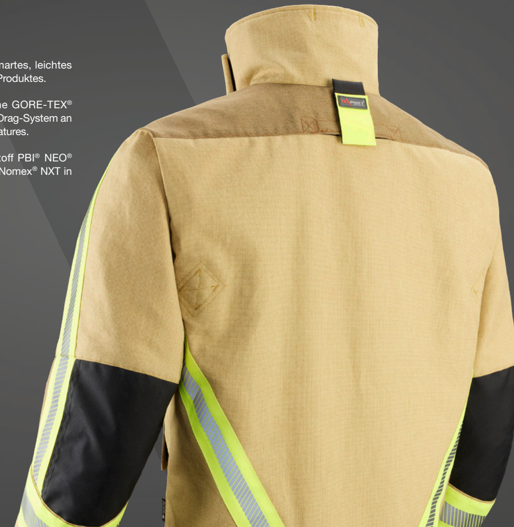
Abb. FIRE BLAZE, WA15, 545

Erhältlich ist das Modell mit dem Oberstoff PBI® NEO® Y55 in der Farbe Gold/Cognac sowie mit Nomex® NXT in Dunkelblau sowie in Gold/Dunkelblau.