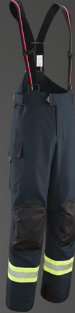
PBI® NEO® Y55 Gold / Cognac 545