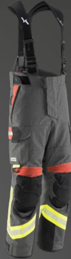
FIRE X-FLASH IB-TEX® Dunkelblau / Gold 542